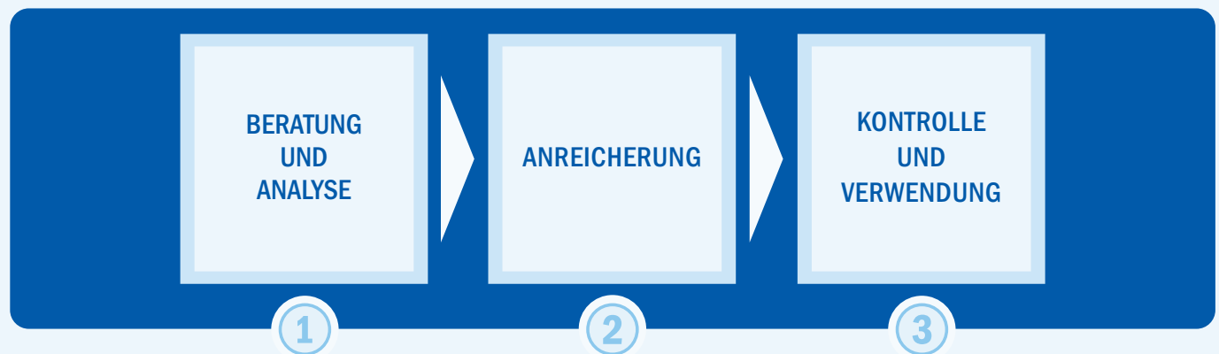
3-Stufen-Modell PRODATA Datenanreicherungsleistung

PRODATA bietet Ihnen eine Vielzahl von Möglichkeiten Ihre Kundendatenbank mit Informationen zu Privatpersonen oder Firmen anzureichern. Wir haben Zugriff auf Daten aus Europa und aller wesentlichen Industrienationen. Nutzen auch Sie ergänzende Informationen für eine effizientere und individuellere Kommunikation mit Ihren Kunden.